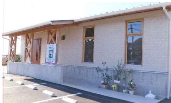
店名：田舎の保健室 LinkS 住所：防府市上右田 10113-1 営業時間：10:00 - 18:00 定休日：木曜日

入院された患者様の多くは、最初は自宅でも望まれているのですが、その望みが叶う方は1割程度とされています。そんな現状をずっと見てきて、色々考えるようになった時、訪問看護のスペシャリストと呼ばれている方が、第2の我が家のような柔らかな雰囲気の中で、病気の悩みや健康に関する心配ごとを相談できる場所を運営されていることを知り、防府でもこのような施設を作りたいと思ったことがきっかけです。