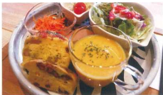
おすすめランチ「米粉のケーキサレプレート」